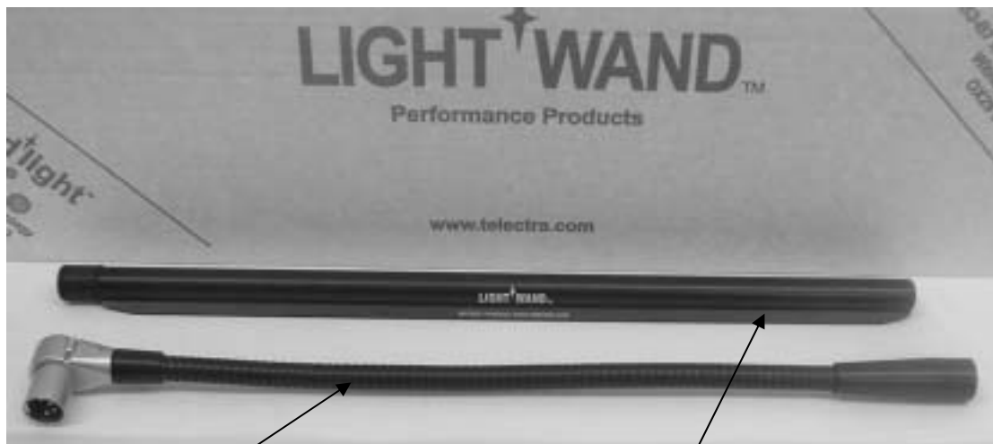
グースネック (ストレート型/L型、XLRコネクター)

警告: 必ず Light*Wand™ヘッドとグースネックを1つのユニットとして組み立ててから、コンソールに着脱するようにしてください。