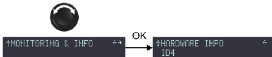
図 1 : LA4X の DSP ボードのバージョン確認

LA4X フロントパネルから [MONITORING & INFO] メニューの HARDWARE INFO にアクセスし、LA4X の DSP ボードに搭載しているイーサネットポートの種類を確認できます。この確認機能はファームウェアバージョン 1.2.0 以上で利用できます。(フルリリースバック - June 9, 2015 LA NETWORK MANAGER 2.3.0.0 に含まれます。)