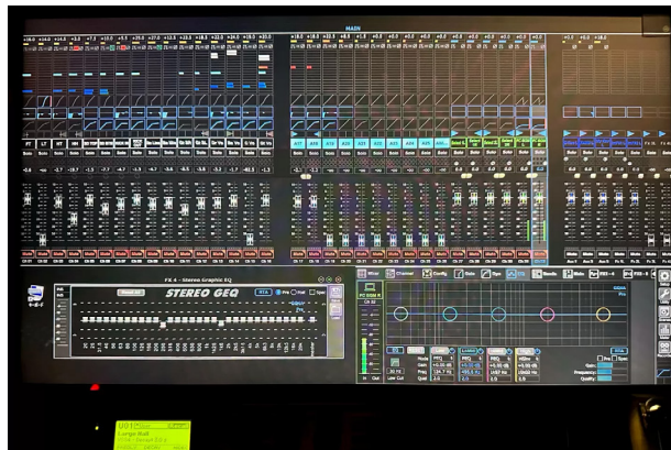
コンソールルームに設置された大型ディスプレイに M32 のソフトウェア (M32 EDIT) を表示して運用