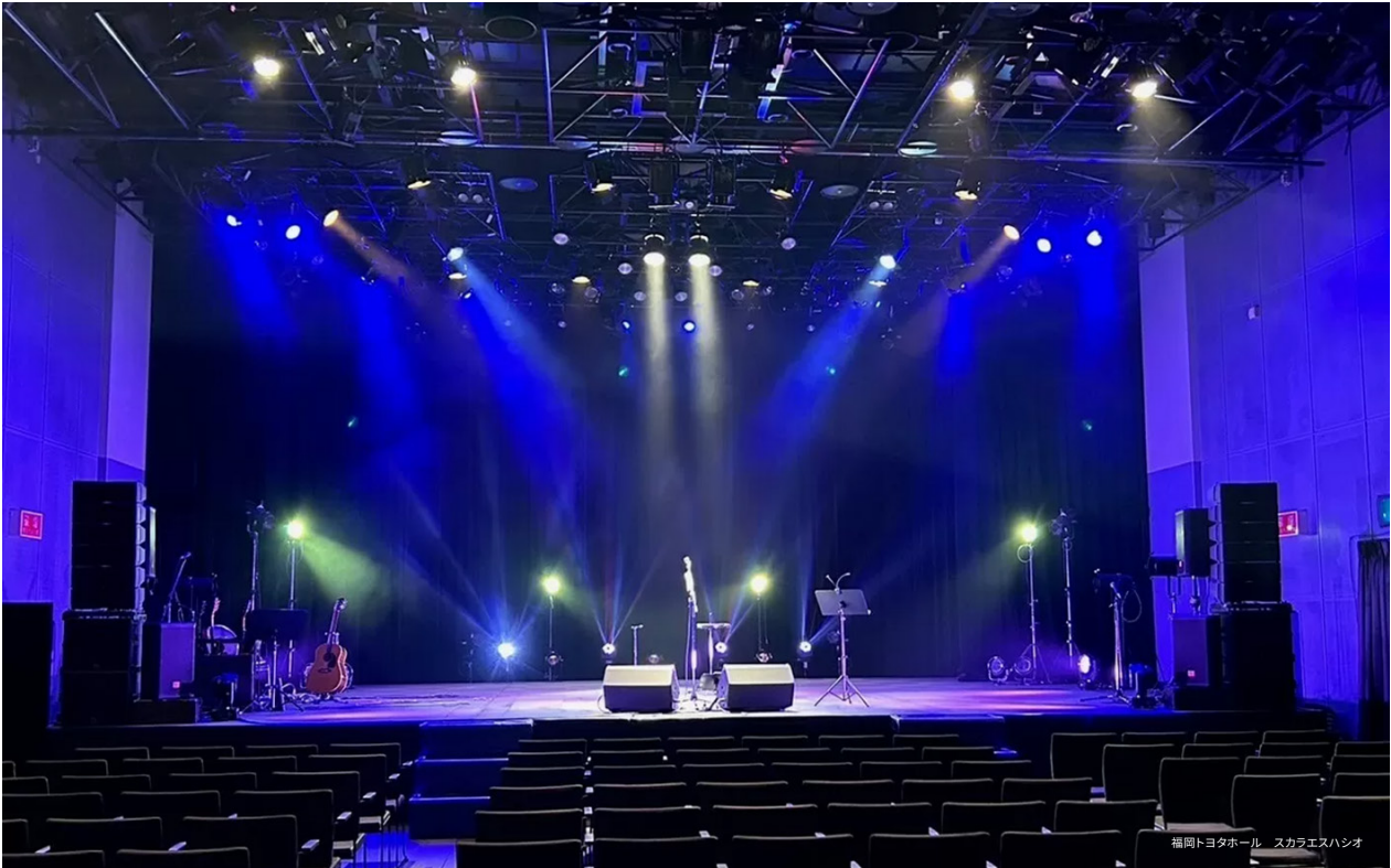
福岡トヨタホール スカラエスハシオ

福岡の「有限会社ガレージワン」様がKIVA II、SB15m、LA4Xを導入しました。グループ会社の「株式会社スタッフ」様所有のKARA IIとARCSと合わせることで、今まで以上に仕事の幅が広がったとの事です。今回、質問をメールでお送りし、お答えいただく形でお話を伺いました。